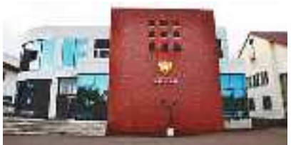
1階に現図書館(室)を有する鳳鳴記念館

を数十年の単位で過ぎていくジュースが放置されていたらしいというこら。探してみれば見つかるかも…。しかし、飲むのはお勧めしない。 七つ目の不思議! 鳥たちの悲劇。記念館のガラスに鳥たちが衝突死する事件が稀にあったらしい。壁があることに気付かずぶつかつてきたようだ。ぶつかつてしまった鳥は運が悪かつたとしか言いようがないだろう。これらは記念館が建てられてから見つけられた、または作られたものであるが、そのすべてはもう忘れられてしまつている。時間の流れというものは本当に早いものである。忘れないようにしたいものだ。 余談だが、大館鳳鳴高校そのものにも七不思議があつたらしい。学校がまだ第二尋常中学校だったころから伝わっているらしく「井戸の怪」、「墓場の影」等興味を惹かれるものばかりだ。興味を持つた人は是非調べてみて欲しい。