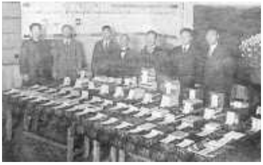
勅諭記念文庫に寄贈された図書 (「鳳凰」J53号)

明治三十二年頃は、第二尋常中学校の学校規則で学習不要物の持ち込みは禁止とされていた。そのためこの当時では、蔵書としてはもちろん、持参したものであったとしても小説などを読むことは禁止とされていたらしい。この後も蔵書数は確実に増えていき、明治三十八年には四三九六冊、明治四十二年には六一三二冊にまで増えた。その上、当時の寄宿舎にも図書館が開設されることとなり、六種類の新聞、十種類余りの雑誌も読むことができるようになった。しかし、明治四十三年に校舎火災がおこったことにより、図書館の蔵書は全て焼失してしまった。また一からのスタートとなったが、その二年後には一六九冊の蔵書数となり、今現在では三万八千三三六冊という一度すべて焼失したとは考えられないほどの数の本が蔵書として保管されている。 そんな歴史を辿ってきた鳳鳴高校図書館であるが、自分たちの年代が知る一番大きな変化と言えは図書館の記念館への移設